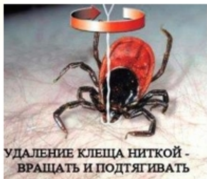
УДАЛЕНИЕ КЛЕЩА НИТКОЙ - ВРАЩАТЬ И ПОДТЯГИВАТЬ

Вытянуть клеща нитяной петлей или пинцетом