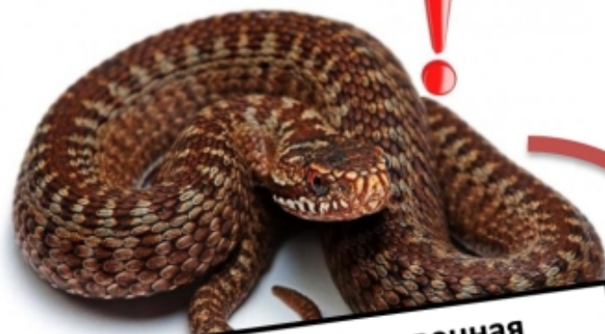
Гадюка обыкновенная Единственная ядовитая!!!